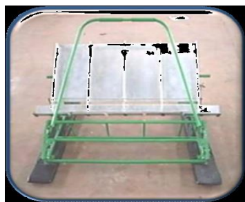
Alat Tanam Padi (Transplanter)